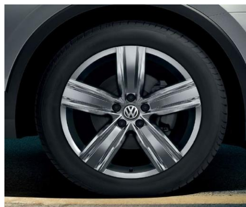
Victoria Falls 7J x 19