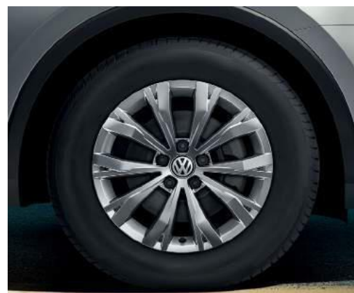
Montana 7J x 17