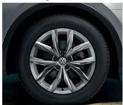
Kingston 7J x 18