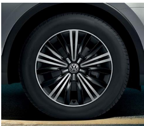
Nizza 7J x 18