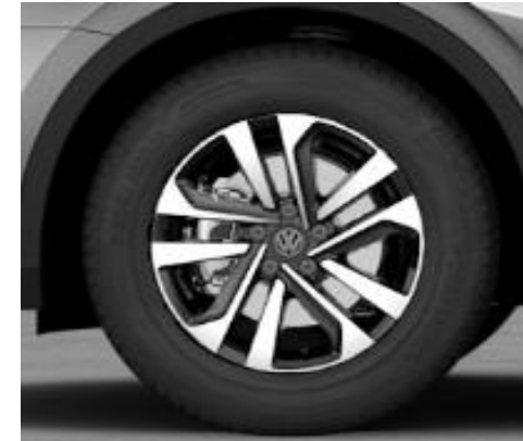
Dublin 7J x 17