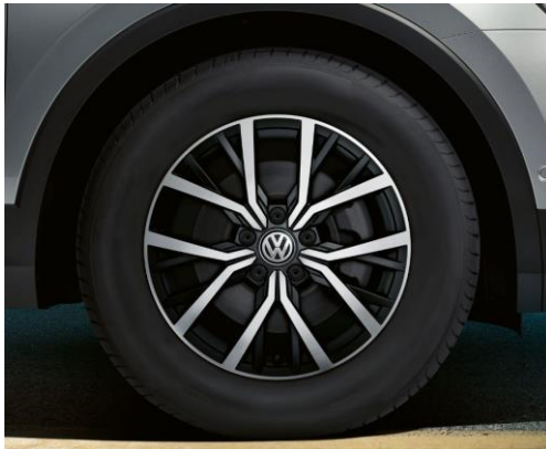
Tulsa 7J x 17