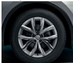
Kingston 7J x 18