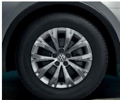
Montana 7J x 17