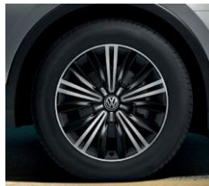
Nizza 7J x 18